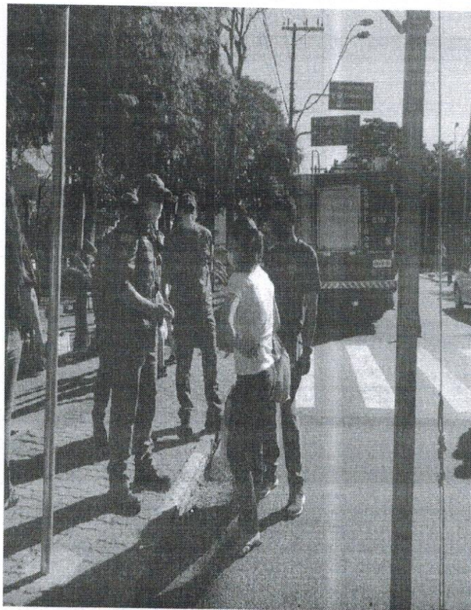
Ação Educativa no Dia Mundial do Meio Ambiente (05/06/2021): conversa com a população sobre o perigo das queimadas