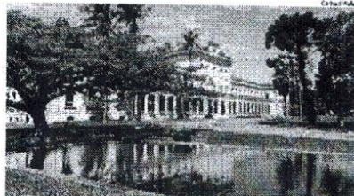
A Escola Superior de Agricultura "Luiz de Queiroz" (Esalq) é referência internacional

tor de Turismo e expressivos atrativos turísticos. Dois projetos de leis caminham na Assembleia Legislativa do Estado de São Paulo (Alesp).