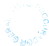
HELIO DONIZETE ZANATTA Prefeito Municipal

Art. 4º Esta lei entrará em vigor na data de sua publicação.